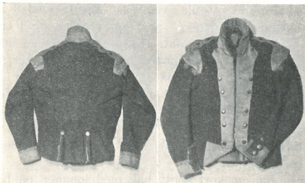
Fig. 2. Kjole for hoboist. 2. Trondhjemske Regiment 1789—1800. (SSL nr. 6639).

Kjolen er rød, med gul krave, oppslag og rabatter, hvitt underfor som vises i trekantede oppklaffinger foran og i kantene om lommeklaffene (foldene) bak, og med halvrunde tinnknapper, 2,5 og 1,7 cm i diameter.