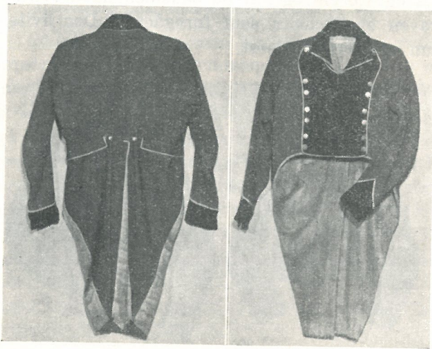
Fig 5. Offiserskjole. Trondhjemske Dragonregiment 1812—14. (SSL nr. 6641).

Den fjerde kjole fra samme sted (6642) er forøvrig helt lik de foregående, men den har spisse oppslag uten knapper, etter uniformsbestemmelsene av 1812. Den har bare en liten skulderklaff på venstre side. Den går fra ca 2 cm innenfor skuldर्सømmene og er festet ca 1 cm