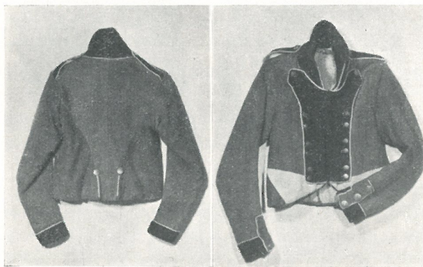
Fig. 4. Kjole for menig. Oplandske Regiment 1800—1812. (SSL nr. 6635).

Kraven er likeledes som foregående. Den hvite kant er foran og rundt nederst.